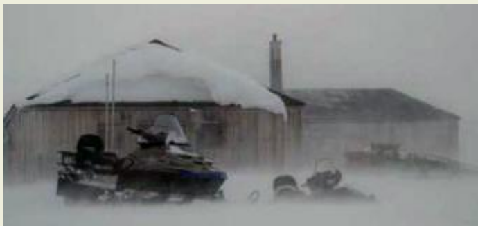
Kinnvikastationen i blåsig väder.