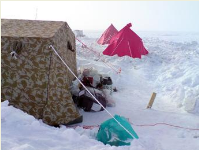
Lägrät på glaciären Vestfonna.