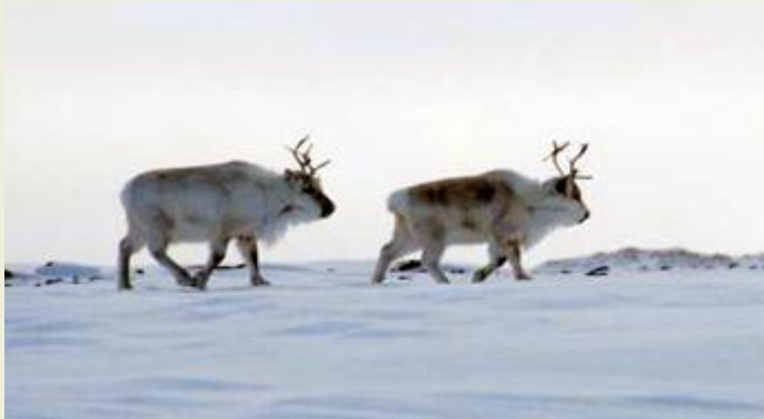
Inte bara isbjörnar kommer på besök. Här vandrar renar förbi.