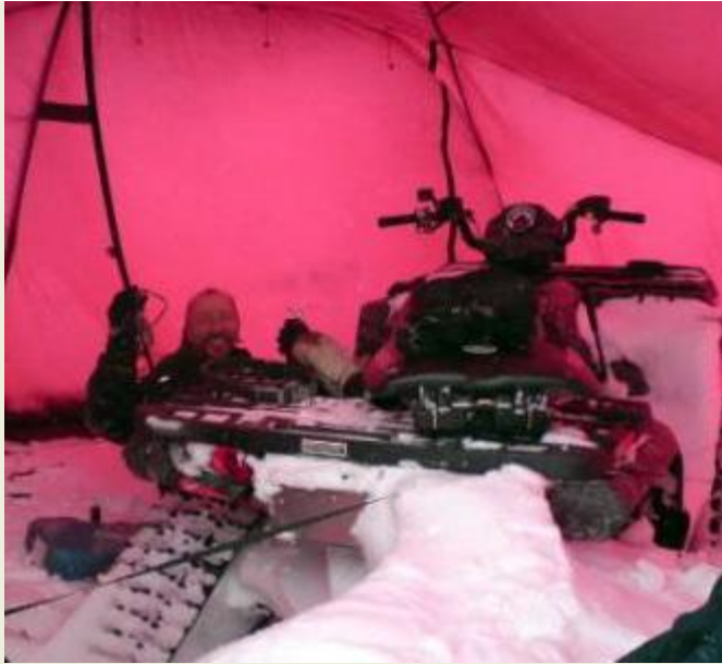
Lasse reparerar fyrhjulingen inne i tältet på grund av blåsten.